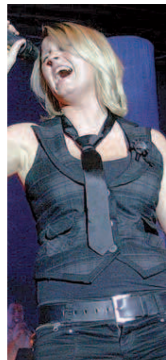
Zehn brillante Musiker stehen bei der einzigartigen Show „Rock Legends“ auf der Bühne.